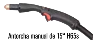
Antorcha manual de 15° H65s